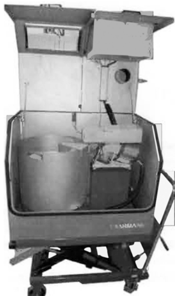
Afb. 2 In de Reject-module draait een bak rond die een representatief monster neemt

De mechanische beveiliging bestaat uit splittoelappende platen met bouten die afbreken als te grote of te harde brokken tussen de maalkaken komen. De brokken krijgen hierdoor de nodige ruimte om de breekplaten te passeren zonder dat de machine ernstig beschadigt. In de zware productieomge-