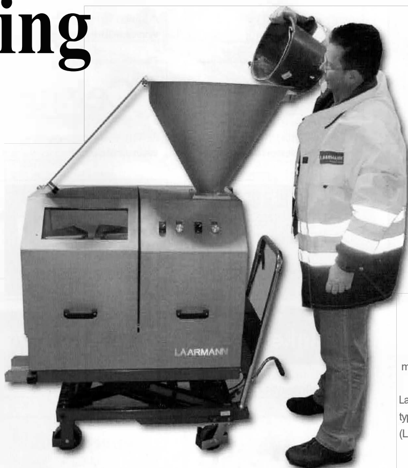
Afb. 1 De te bemonsteren partij kan bovenin de Laarmann Sampler type Multi Purpose (LMS-MP) oorden ingevoerd

De bemonstering van een partij is vaak een omslachtige procedure die de representativiteit van het monster niet ten goede komt. Dankzij slimme oplossingen kunnen de monsterkwaliteit en de werkomstandigheden worden verbeterd. En een kaakbreker hoeft bij de verkleining van materiaal niet te lijden van te grote of te harde brokken en kan door een operator eenvoudig worden ingesteld.